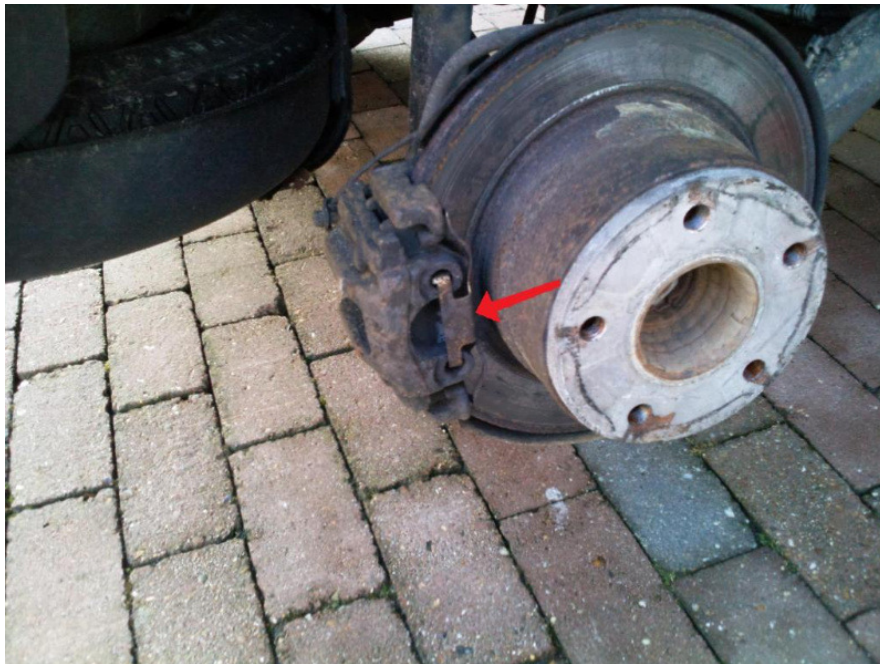
Verwijder de veer op de voorkant. [zie pijl]

Foto's tonen de rechter achterkant, daar zit ook de slijtage indicator.