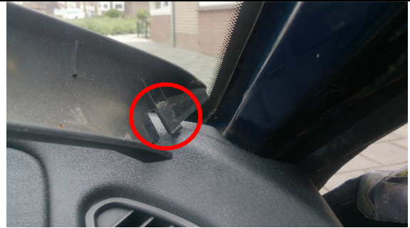
De schuifverbinding onderaan