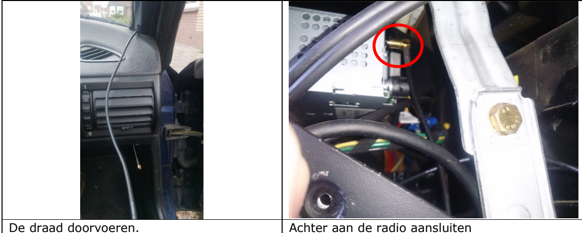
De draad doorvoeren.

De kabel kun je nu doorvoeren door het dashboard en vast maken met tyreps aan de kabelboom. Als het goed is, kun je ook de achterkant van de radio zien. Hier sluit je de antenne aan.