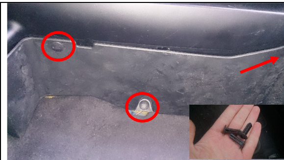
De drie kwart-slag-schroeven

Onder bij de voertuimte zit een plaat onder het dashboard, deze moet eerst weg. Deze zit vast met drie plastic kwart-slag-schroeven en twee schuifverbindingen. Verwijder de drie schroeven en schuif de kap omhoog richting de bijrijdersstoel.