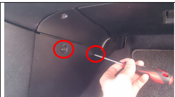
Verwijder eerste de twee schroeven in het middenconsole.

Hoewel dit heftig klinkt, valt het heel erg mee. Gewoon de juiste schroeven in de juiste volgorde losdraaien. Begin met twee schroeven die vast zitten aan het middenconsole.