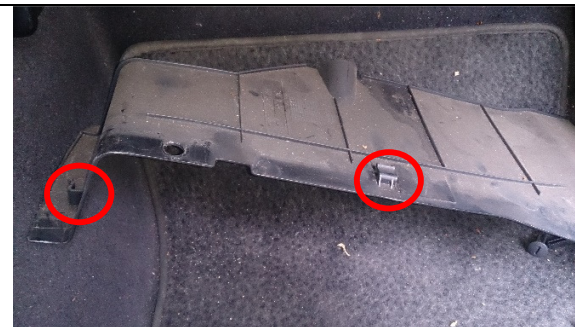
De twee schuifverbindingen