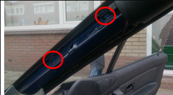
De twee klikpunten waar hij vast zit

Je kunt de sierlijst er gewoon vanaf trekken. Begin bovenaan en trek voorzichtig in de richting van de binnenspiegel, en wanneer de twee klipjes los zijn omhoog. De sierlijst zit vast met twee klikpunten en onderaan met een schuifverbinding.